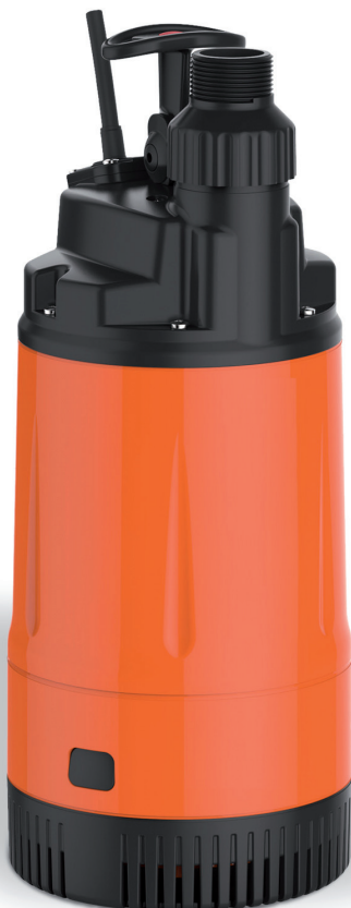
TAUCHDRUCKPUMPE ENVIRO-TECH 550 TP-EU02144